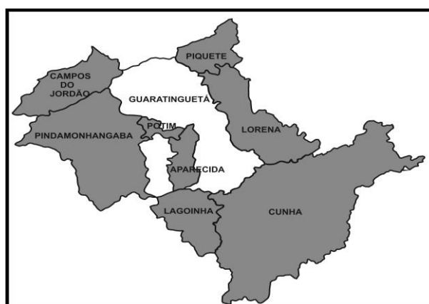
Figura 1 – Guaratinguetá – Limites do Município

Guaratinguetá, encontra-se na Região Administrativa de São José dos Campos, no eixo Rio- São Paulo. Ela dista 175 Km de São Paulo – capital e possui uma área de 752,636 km 2 . Faz limites com Campos do Jordão, Piquete, Cunha, Lagoinha, Aparecida, Potim, Pindamonhangaba e Lorena, conforme a figura ao lado.