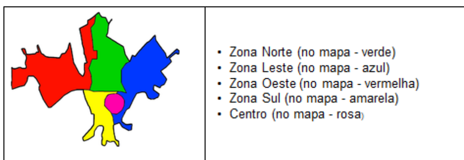
Figura 2 – Zonas de Guaratinguetá

O Centro da cidade pode ser dividido em centro histórico e centro expandido.